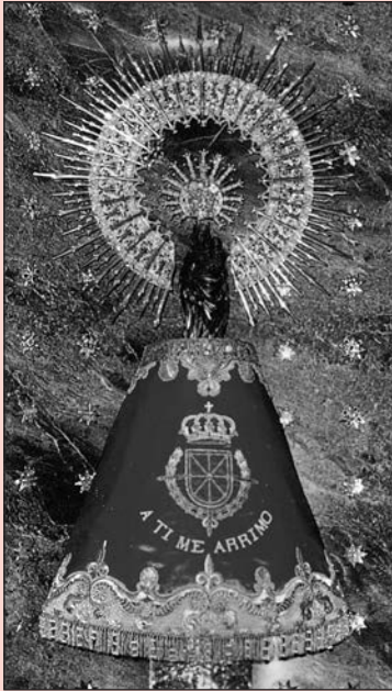
¡Bendita y alabada sea la hora...!

Ángel Custodio de España, tan olvidado. A ti acudimos en estos tiempos difíciles. Dios te ha encomendado la misión de ser nuestro Protector y Defensor en el peligro. Te imploramos para que nos guíes en medio de las tinieblas de los errores humanos y seas nuestro escudo protector ante los enemigos exteriores e interiores de nuestra Patria, alcancemos la reconquista de la Unidad Católica de España y podamos ver la restauración del Reinado Social del Sagrado Corazón de Jesús, y de esta forma España vuelva a ser el paladín de la Fe Católica. Ángel Custodio de España: