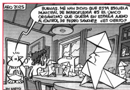
ABC, 4 de diciembre, 2022

El miércoles 7 de diciembre, se producía la destitución y detención del presidente de Perú, Pedro Castillo, por intentar disolver el Congreso, el Poder Judicial y el Tribunal Constitucional. Un golpe de Estado encubierto. En relación con esta noticia, en España podríamos preguntarnos si el presidente Pedro Sánchez igualmente disolvió el Congreso, al presentar una “moción de censura” con acusaciones falsas contra Rayoy, y que igualmente intenta modificar el Poder Judicial y el Tribunal Constitucional.