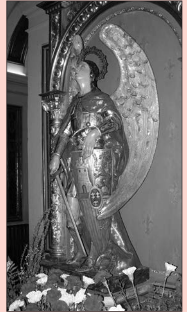
¡A ti acudimos...!

Del olvido de Dios, libranos. De las guerras, libranos. De todo mal, libranos. Ayúdanos, protégenos y sálvanos.