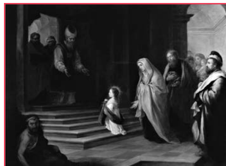
Bartolomé Esteban Murillo. Óleo sobre lienzo, 155 x 210 cm.

Este cambio de táctica comunista, a modo del abrazo del oso, se refleja en lo que dijo Dolores Ibarruri, (a) La Pasionaria , en el Círculo Julián Grimau de La Habana en Cuba: " Actualmente, nosotros sabemos que por la fuerza nada podemos conseguir. Pero existen otros medios para obtener la victoria; mezclarnos con ellos —los católicos—. Muchos de los nuestros están situados en puestos de responsabilidad en las filas católicas. Estos abrirán el camino a los demás... El fanatismo de la fe va unido a los españoles. Invocado el nombre de Dios les podremos manejar. Por ello, es necesario no herirles en sus sentimientos católicos hasta que nosotros podamos imponer nuestra ley. Las nuevas tendencias que han hecho su aparición entre los católicos franceses, totalmente divididos, puede ser nuestra gran solución para Espa-