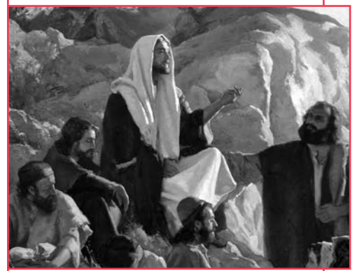
Y abriendo su boca, les enseñaba, por Michael Malm.

Sí, ya sé que todo tiene explicación, pero fuera de toda lógica... y mi mente no