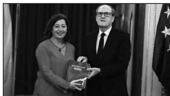
Ángel Gabilondo, defensor del Pueblo, entrega a la presidenta del Congreso el informe sobre abusos en la Iglesia

La falta de un proceso de verificación riguroso ha suscitado críticas hacia los responsables de la inclusión de este caso en informes significativos. El error no solo cuestiona la credibilidad de las instituciones implicadas, sino que también pone en riesgo la integridad de las víctimas verdaderas y de aquellos injustamente acusados.