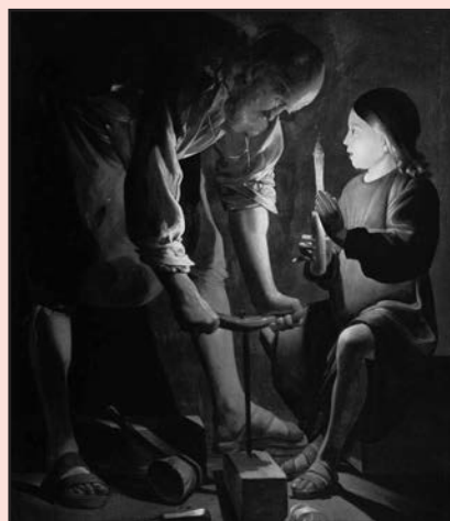
San José, carpintero. Óleo de Georges de Latour (1593-1652)

Pío IX en 1847 estableció para la Iglesia universal la celebración de San José como patrono de los trabajadores, fijándola para el tercer domingo de Pascua. León XIII, en su encíclica Quamquam pluries , resalto el papel del trabajo en la vida de San José y su ejemplo para los trabajadores. Y Pío XII fue quien en 1955, estableció su memoria litúrgica el 1 de mayo, con el título de San José Obrero, día que el mundo celebra el Día del Trabajo.