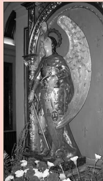
¡A ti acudimos...!

Del olvido de Dios, libranos. De las guerras, libranos. De todo mal, libranos. Ayúdanos, protégenos y sálvanos.