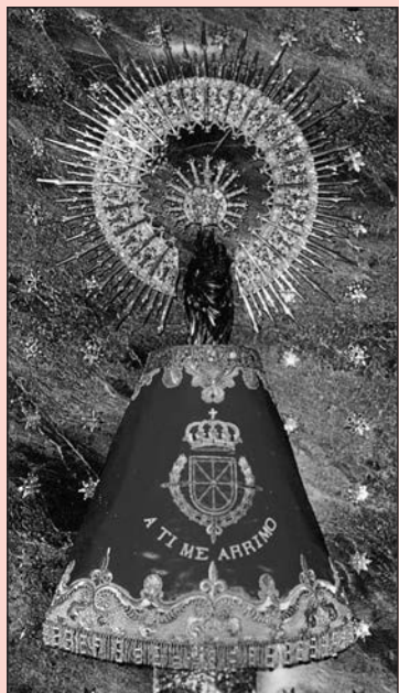
¡Bendita y alabada sea la hora...!

ÁNGEL CUSTODIO de ESPAÑA, tan olvidado. A ti acudimos en estos tiempos difíciles. Dios te ha encomendado la misión de ser nuestro Protector y Defensor en el peligro. Te imploramos para que nos guíes en medio de las tinieblas de los errores humanos y seas nuestro escudo protector ante los enemigos exteriores e interiores de nuestra Patria, alcancemos la reconquista de la Unidad Católica de España y podamos ver la restauración del Reinado Social del Sagrado Corazón de Jesús, y de esta forma España vuelva a ser el paladín de la Fe Católica. Ángel Custodio de España: