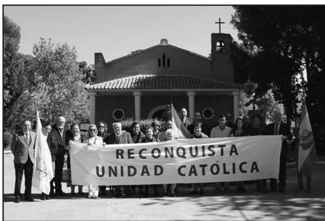
Algunos de los asistentes frente a la Ermita de la Virgen de Alfindén (Zaragoza).