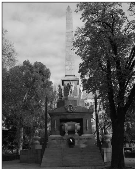
Obelisco del Dos de Mayo (1821-1821) *