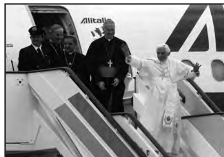
Llegada del Papa a Madrid para la celebración de la JMJ 2011

Debido al gran amor que sentía por España, Benedicto nos visitó en tres ocasiones (sin contar las que hizo como cardenal), y hubo países que no visitó nunca. En 2006, visitó Valencia con ocasión del Encuentro Mundial de las Familias. Cinco años más tarde, en 2010, visitó Santiago de Compostela, con motivo del año Jacobo, y Barcelona, para la consagración del templo de la Sagrada Familia. Y en 2010, visitó Madrid con motivo de la Jornada Mundial de la Juventud.