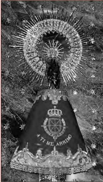
¡Bendita y alabada sea la hora...!

Ángel Custodio de España, tan olvidado. A ti acudimos en estos tiempos difíciles. Dios te ha encomendado la misión de ser nuestro Protector y Defensor en el peligro. Te imploramos para que nos guíes en medio de las tinieblas de los errores humanos y seas nuestro escudo protector ante los enemigos exteriores e interiores de nuestra Patria, alcancemos la reconquista de la Unidad Católica de España y podamos ver la restauración del Reinado Social del Sagrado Corazón de Jesús, y de esta forma España vuelva a ser el paladín de la Fe Católica. Ángel Custodio de España: