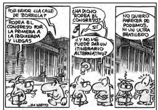
ABC, 10 enero, 2023

Hasta hoy, la deformación grotesca de la realidad utilizada por Valle-Inclán en su teatro, estaba al servicio de una implícita intención crítica. Hoy, al menos en España, no es así. Y no es así, porque, entre la corrección política que dicta el sistema, particularmente el gobierno socialcomunista presidido por el narcisista Pedro Sánchez, y el miedo a ser sancionados o calificados, estamos llegando a una deformación tan grotesca de la realidad, que en pocos años pueden convertirnos en una sociedad que por falta de entendimiento tenga que ser calificada de estúpida. Y no es que se lea entrelíneas, lo que ocurre es que se prejuzga desde los prejuicios y las intenciones.