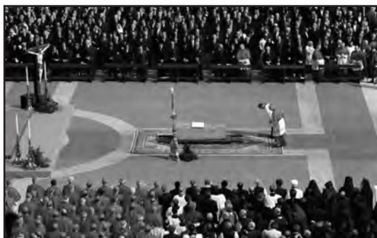
5 de enero. Funeral por Benedicto XVI en la Plaza de San Pedro. Despedida multitudinaria para un Papa querido

Y de ese misterio, y de un ambiguo discurso dado por su secretario, monseñor Gänswein, sugiriendo que, en algún sentido, seguía siendo Papa, surgió un estado de opinión que pronto cristalizó una corriente dentro del comentario católico: el 'benevacantismo', como ha sido humorís-