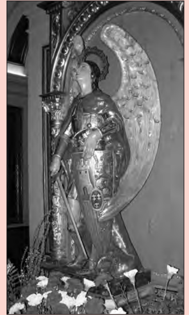
¡A ti acudimos...!

Del olvido de Dios, libranos. De las guerras, libranos. De todo mal, libranos. Ayúdanos, protégenos y sálvanos.