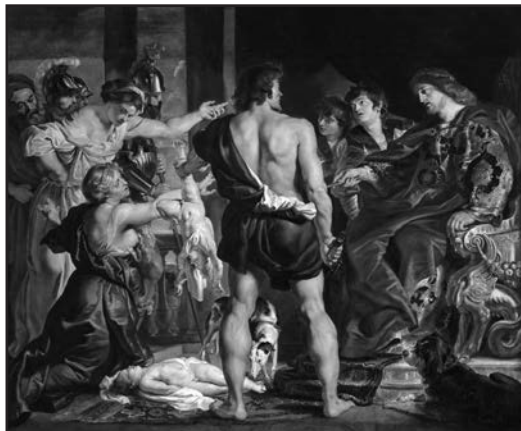
El juicio de Salomón de Pedro Pablo Rubens (Museo Nacional de El Prado)

Yo la definiría de forma pragmática y de fácil comprensión como la “capacidad para conocer la finalidad de nuestra existencia y para vivir en consecuencia, logrando alcanzar el objetivo marcado por el Creador”.