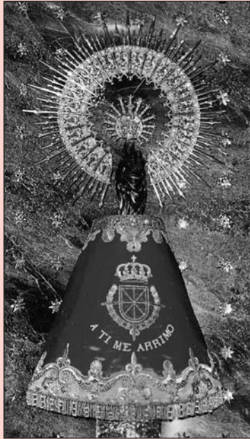
¡Bendita y alabada sea la hora...!

Ángel Custodio de España, tan olvidado. A ti acudimos en estos tiempos difíciles. Dios te ha encomendado la misión de ser nuestro Protector y Defensor en el peligro. Te imploramos para que nos guíes en medio de las tinieblas de los errores humanos y seas nuestro escudo protector ante los enemigos exteriores e interiores de nuestra Patria, alcancemos la reconquista de la Unidad Católica de España y podamos ver la restauración del Reinado Social del Sagrado Corazón de Jesús, y de esta forma España vuelva a ser el paladín de la Fe Católica. Ángel Custodio de España: