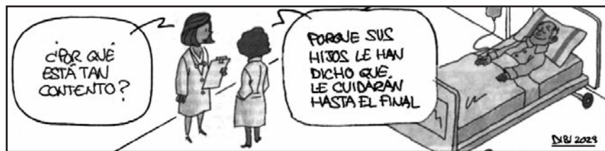
Alfa y Omega, 28 de septiembre-4 octubre, 2023

La eutanasia no es el no inicio o la interrupción de tratamientos dirigidos a prolongar la vida; tampoco el rechazo voluntario a un tratamiento vital por parte de un enfermo capaz, ni la sedación paliativa (tratamientos que alivian el sufrimiento, aunque puedan acelerar la muerte del enfermo, como). Sino el acto deliberado de dar fin a la vida de una persona, producido por voluntad expresa.