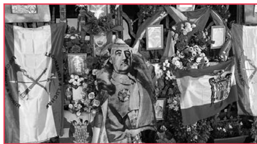
Verja del panteón.