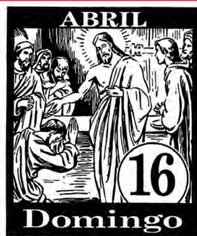
Domingo de la Divina Misericordia Semana II de Pascua

Polonia, como cualquier nación que se considere cristiana o bajo fuerte influencia cristiana, tendrá que valorar si le compensa más estar bajo la influencia cultural del Occidente woke y toda su podredumbre y corrupción moral y social, o romper todo lo posible culturalmente con la civilización woke/progre que hoy representa Occidente. Por múltiples razones, hoy naciones como Irán, Rusia o China, con todos sus defectos, están rompiendo lazos culturales con el Occidente progre. Cualquier nación que quiera