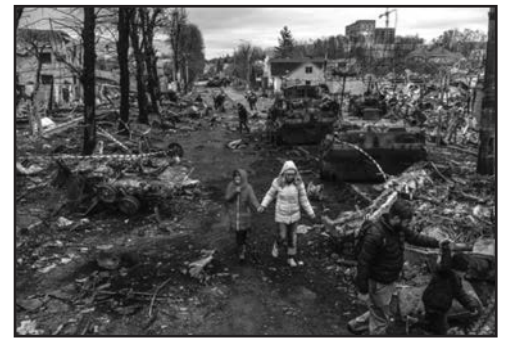
La imagen muestra a una mujer con su hija abriéndose paso por entre los escombros y la desolación producida por las fuerzas rusas en Bucha

Continúa la guerra en Ucrania con la consiguiente devastación, y el reguero de crímenes, violaciones y robos que deja a su paso el ejército ruso. Es significativo lo ocurrido en Bucha, localidad de 30.000 habitantes, cercana a Kiev y que fue de las primeras en ser ocupada. Una vez efectuado el contraataque de las fuerzas ucranianas provocando la retirada del ejército ruso, se han podido ver en las calles y sótanos de dicha ciudad cientos de civiles asesinados con un tiro en la nuca, con las manos atadas, mujeres violadas y torturadas y un sinfín de atrocidades y crímenes de lesa humanidad. Los principales esfuerzos militares rusos se centran ahora en preparar una ofensiva para establecer un control total sobre el territorio de las regiones ucranianas de Donetsk y Lugansk, en el este del país, y Mariúpol, en el sur, según el último parte del Alto Mando del Ejército ucraniano. Mientras, la artillería rusa volvió a bombardear intensamente este miércoles las ciudades de Mariúpol y Járkiv.