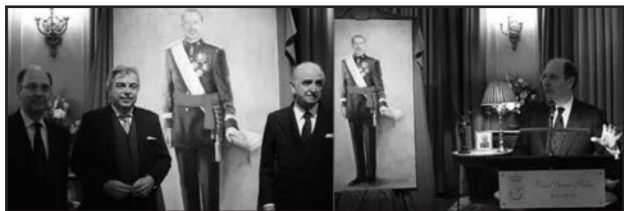
Miguel Ayuso exponiendo en la inauguración de un cuadro de Felipe VI.

“...y echaba la culpa a la malignidad del tiempo, devorador y consumidor de todas las cosas” (Quijote I, IX)