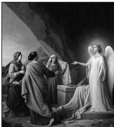
El primer día de la semana, las mujeres fueron al sepulcro, y no hallaron el cuerpo del Señor Jesús.

Tristemente en nuestros días, una inmensa cantidad de católicos viven ajenos a este fundamento de nuestra Fe y han olvidado lo que proclaman en el Credo. Dicho en otras palabras, no dan importancia a la verdad fundamental de la Resurrección de la carne .