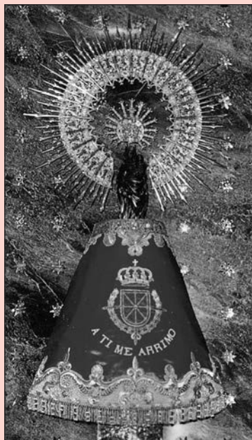
¡Bendita y alabada sea la hora...!

ÁNGEL CUSTODIO de ESPAÑA , tan olvidado. A ti acudimos en estos tiempos difíciles. Dios te ha encomendado la misión de ser nuestro Protector y Defensor en el peligro. Te imploramos para que nos guíes en medio de las tinieblas de los errores humanos y seas nuestro escudo protector ante los enemigos exteriores e interiores de nuestra Patria, alcancemos la reconquista de la Unidad Católica de España y podamos ver la restauración del Reinado Social del Sagrado Corazón de Jesús, y de esta forma España vuelva a ser el paladín de la Fe Católica. Ángel Custodio de España: