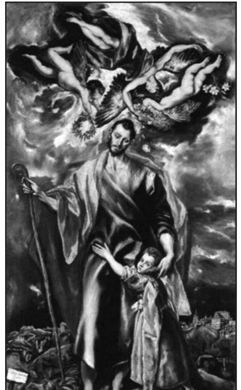
El Greco. San José y el Niño Jesús , 1590. Capilla de San José (Toledo)

Lo mismo pasa con Bergoglio, porque si bien es verdad que critica la desigualdad, las finanzas, el capitalismo... lo cierto es que critica también todo lo que en concreto