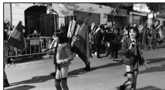
Carnaval, Ayuntamiento de Torrevieja.

Los hechos denunciados son constitutivos de un delito de utilización de menores para espectáculos exhibicionistas de contenido sexual, según el artículo 189.1 del Código Penal.