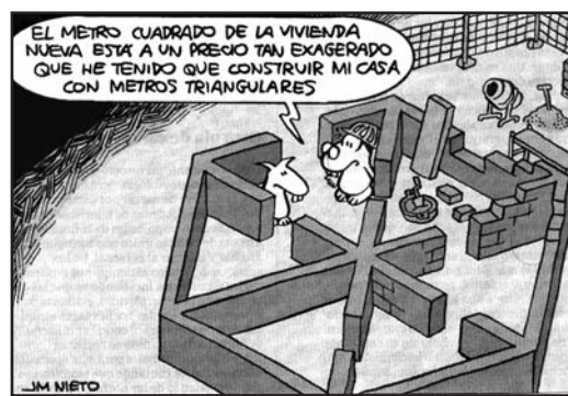
ABC, 9 de agosto 2023

La viñeta en el periodismo tiene una función principal más allá de sacarnos una sonrisa, que es otro de sus valores. La viñeta nos hace pensar, considerar sobre un problema. La de hoy, sobre el negocio especulativo de la vivienda, que es, no lo olvidemos, un derecho fundamental consagrado en el artículo 47 de la Constitución Española, que declara... "que todos los españoles tienen derecho a disfrutar de una vivienda digna y adecuada y atribuye a los poderes públicos la obligación de promover las condiciones necesarias y establecer las normas pertinentes para hacer efectivo este derecho". Pese a todo, los jóvenes españoles no se pueden independizar y mucho menos formar una familia.